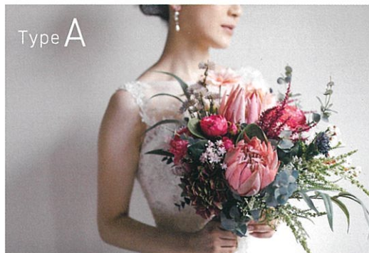
11,000円(税込) プロテアがアクセントのシックスタイルが叶うブーケ