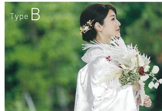
8,800円(税込) トレンド感ある和装スタイルの仕上げに